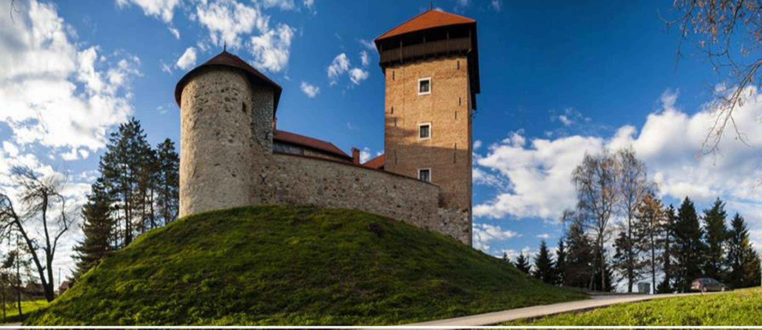
Stari grad Dubovac